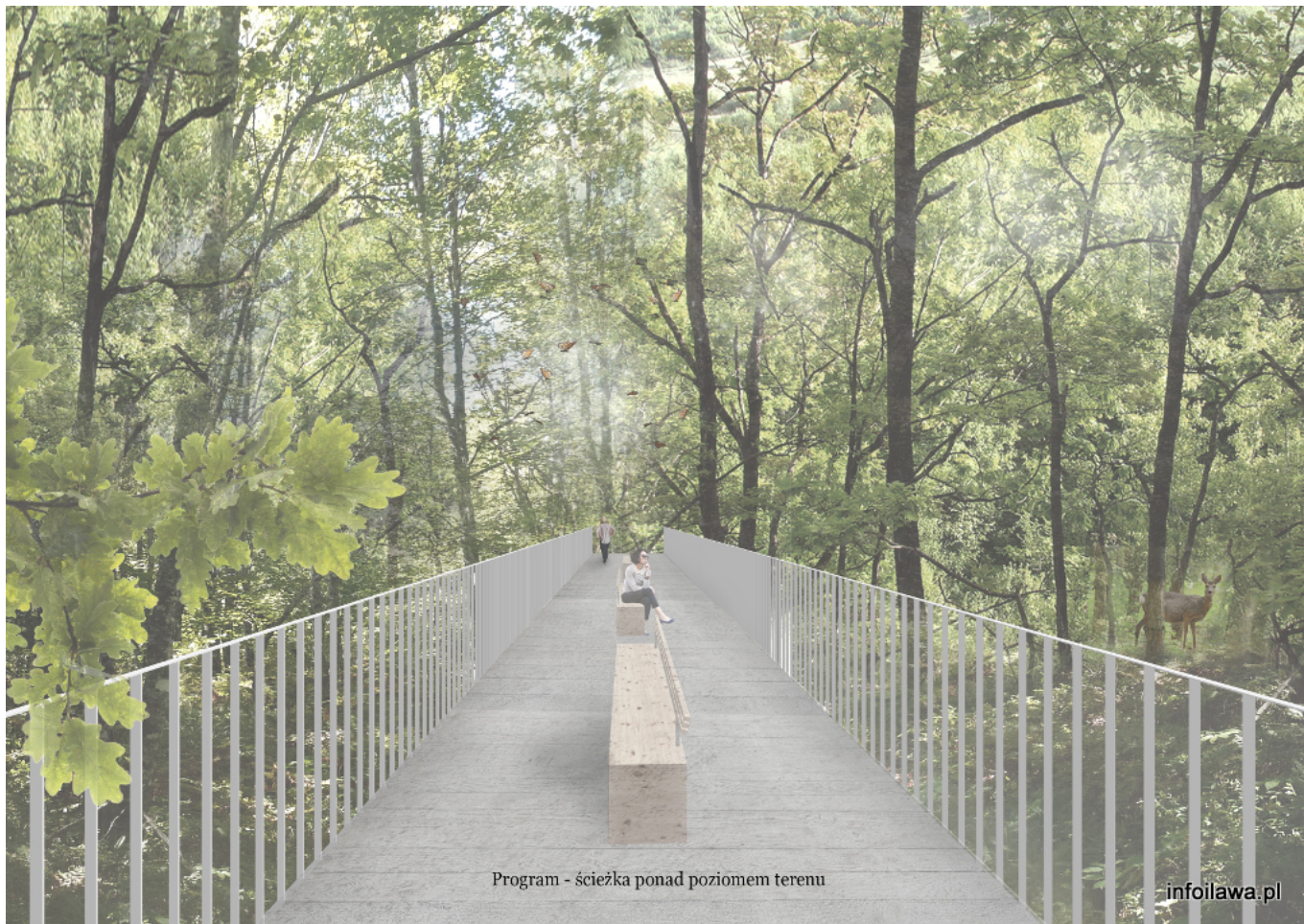
Program - ścieżka ponad poziomem terenu