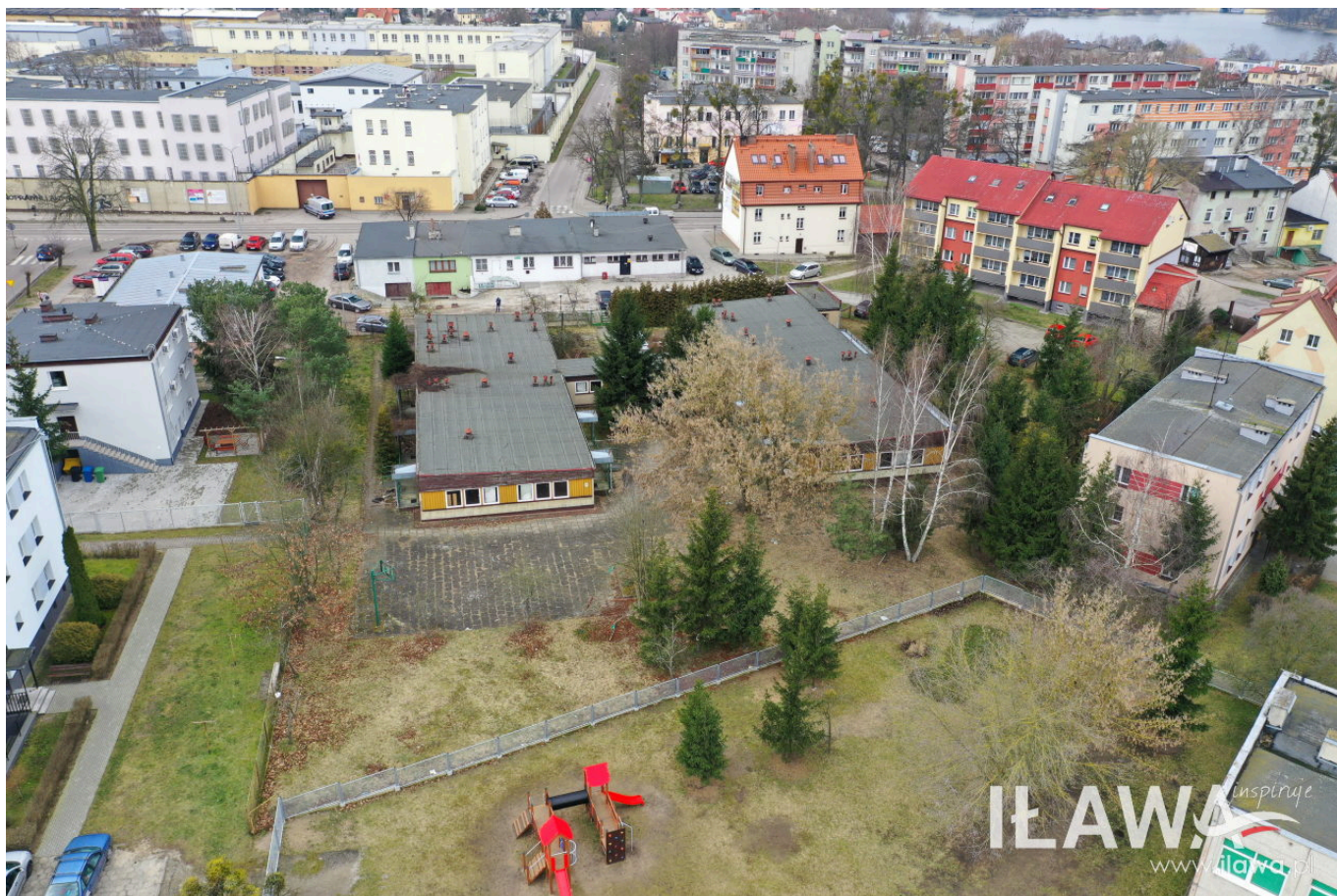
Fot. 2 - Budynek po dawnych WTZ jest zlokalizowany w obrębie aż 4 dużych osiedli – Podleśnego, Gajerka, XXX-lecia i ul. Kopernika. Mieszka na nich wiele młodych rodzin, dla których miejsce w żłobku to szansa na powrót do pracy i osobisty rozwój.

Trzecim tematem jest budowa muzeum. Zabezpieczono w miejskim budżecie pierwsze środki na badania architektoniczno-konserwatorskie budynku przy ul. Mazurskiej 2. Badania te staną się wytycznymi do opracowania dokumentacji projektowo-konserwatorskiej, na podstawie której będzie można wykonać ewentualne roboty budowlane.