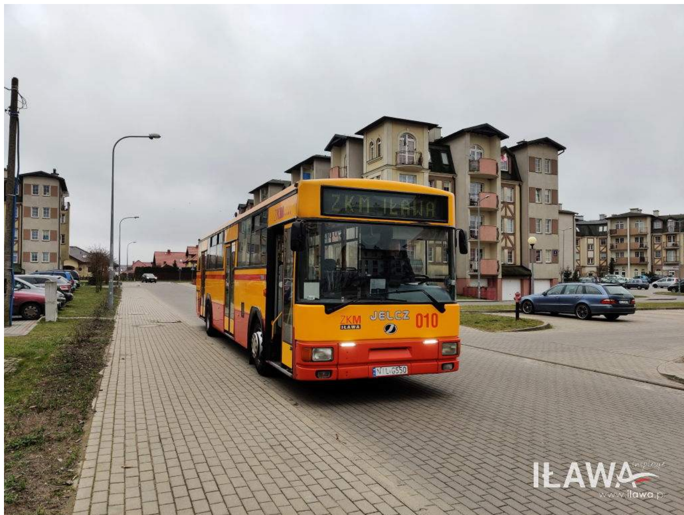
Fot. 1 - Z przeprowadzonej analizy wynika, że potrzebne są nowe bilety i najprawdopodobniej nowe trasy i przystanki.

Drugim tematem, który rozpoczyna swoje administracyjne przygotowania, jest opracowanie koncepcji nowego żłobka. Padła także wstępna propozycja lokalizacji - budynek po dawnych Warsztatach Terapii Zajęciowej. Na ostatniej sesji radni Rady Miejskiej w Iławie przyjęli propozycję burmistrza, aby wygospodarować środki na opracowanie koncepcji stworzenia nowego żłobka.