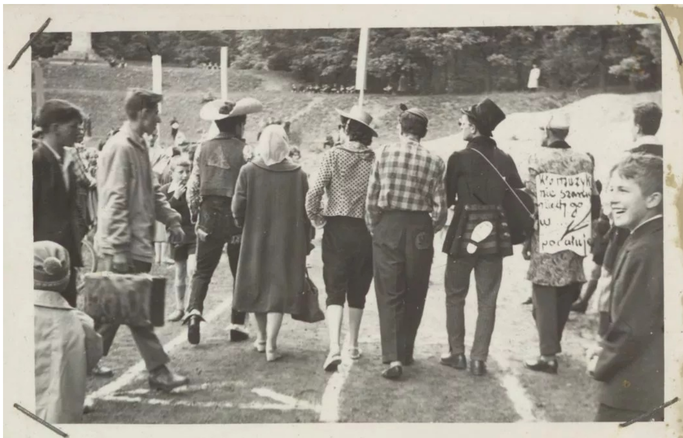
Młodzież z liceum wchodzi na teren stadionu. Po lewej stronie widać budynek sali gimnastycznej.