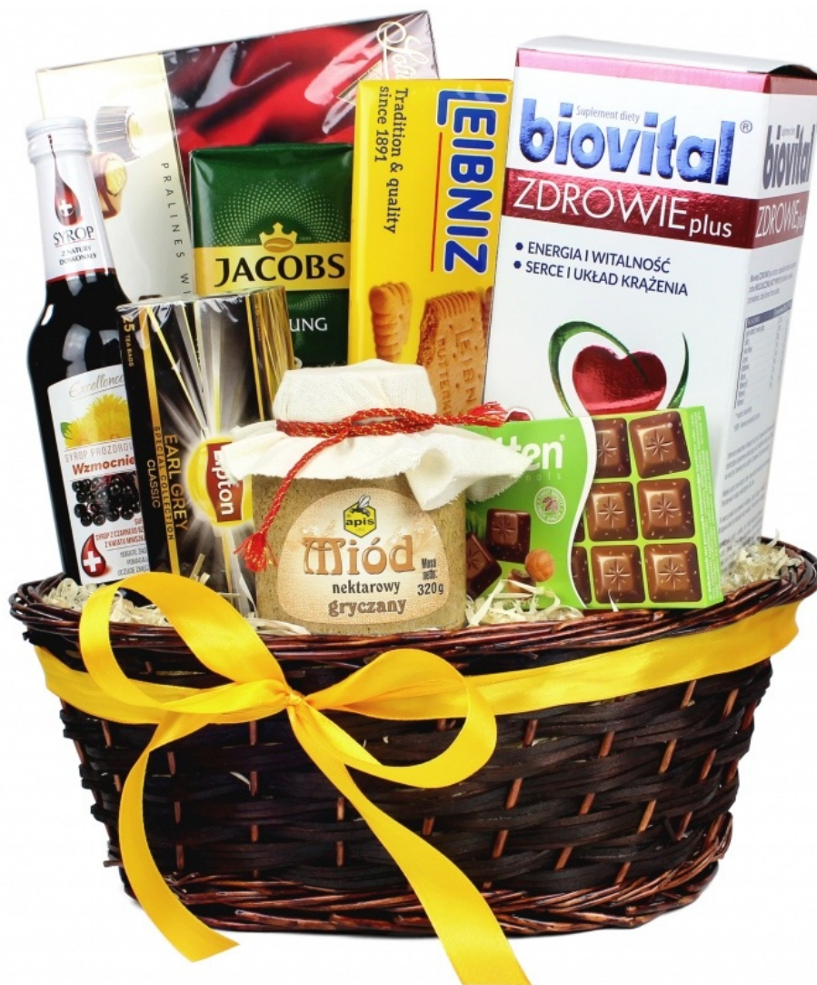
Kosz prezentowy Z życzeniami zdrowia

Rezygnacja z personalizacji. Kartka z odręczną dedykacją to minimum, które zmienia zwykły zakup w przemyślany gest. Większość sklepów umożliwia dołączenie bilecika nawet przy ekspresowej realizacji, bez wpływu na czas dostawy. Bardziej zaawansowane opcje, takie jak grawerowanie czy niestandardowe opakowanie, przy last minute zazwyczaj nie wchodzi w grę — ale kartka wystarczy.