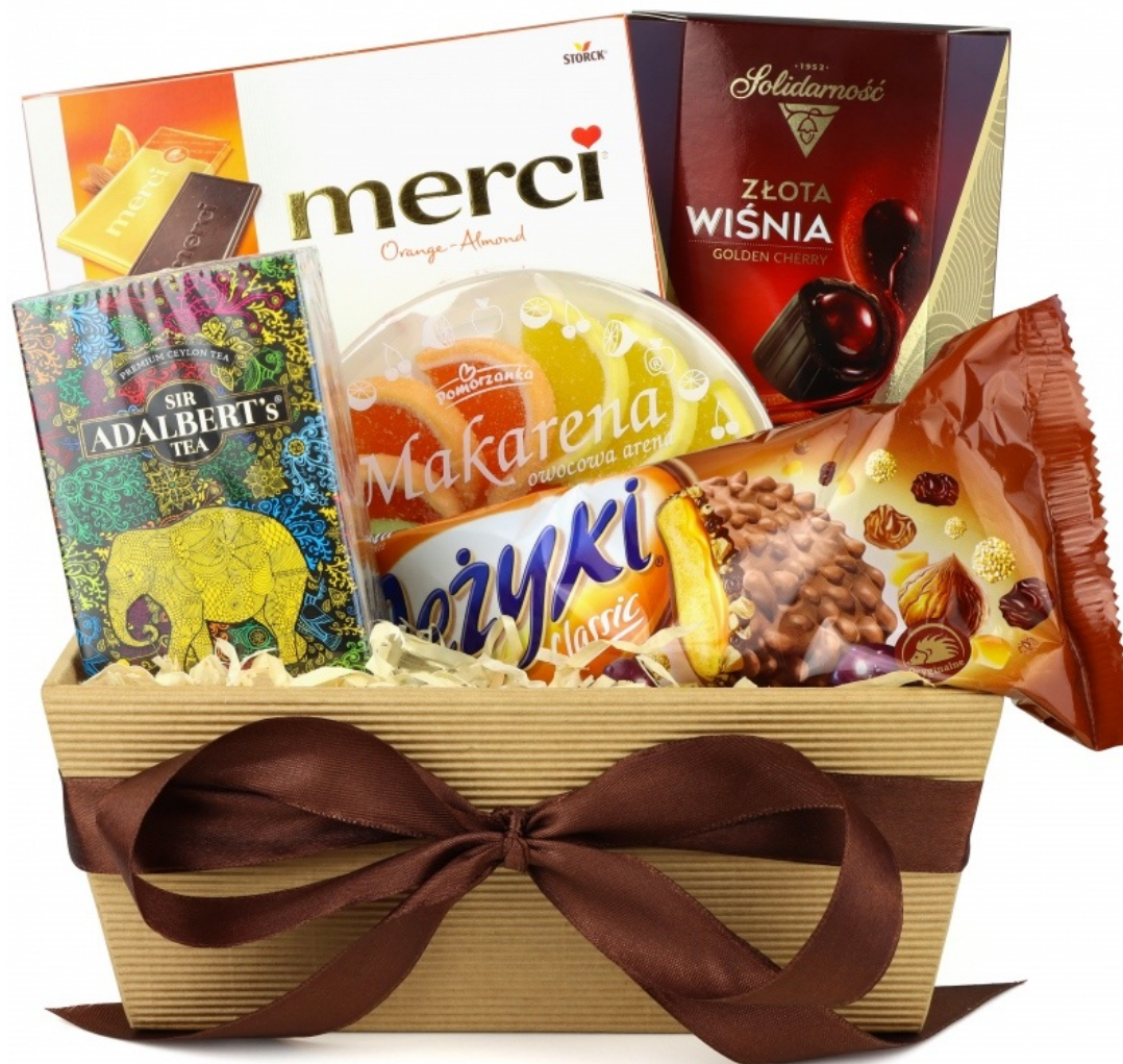
Zestaw prezentowy Owocowa przyjemność

minute to za długo. Gotowe zestawy są pakowane od razu po złożeniu zamówienia.